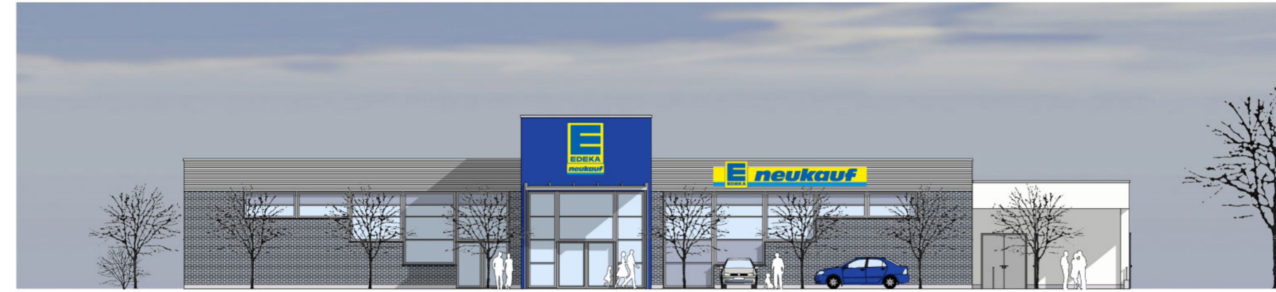
Ansicht Nord, M 1:200